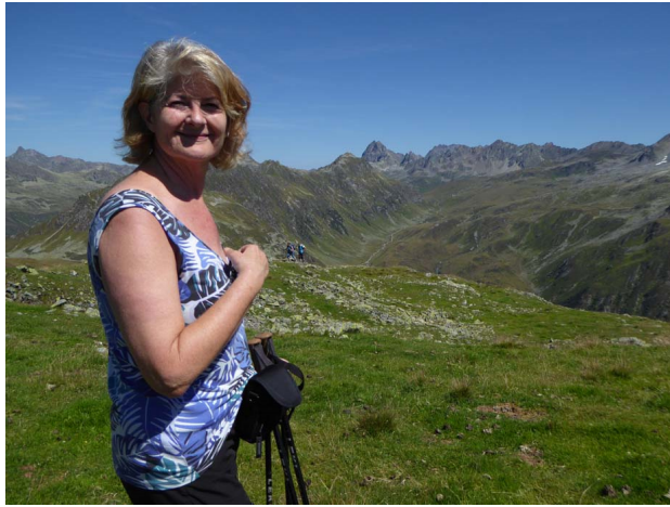
Versailspitze 2462 m ü M