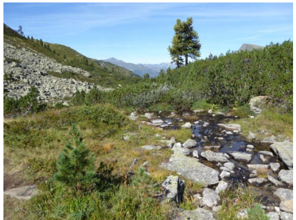
Breitspitze 2133 m ü M