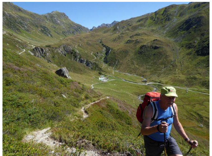
Aufstieg zur Versailspitze